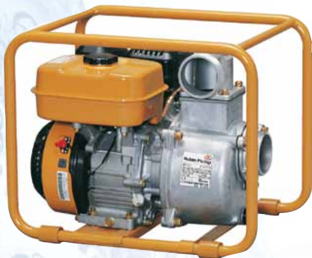
TH 63 EX