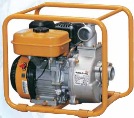
TH 45 EX

Super trash, Gasoline / Sehr zähflüssiges Wasser, Benzin